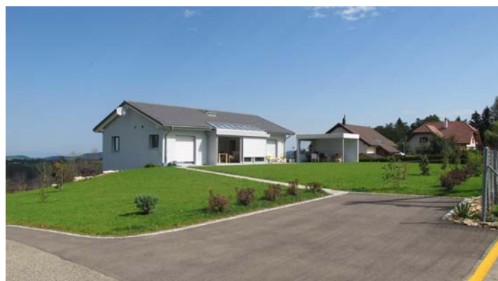
Quartier d'habitation à Saulcy

Les autorités doivent assurer une utilisation mesurée du sol afin de préserver les terres agricoles et les qualités paysagères. Dès lors, il devient fondamental de coordonner les potentiels d'accueil et de densification de la zone à bâtir à un niveau régional. Cette vision valorise au mieux les différents atouts de la Haute-Sorne et évite une concurrence stérile entre les villages.