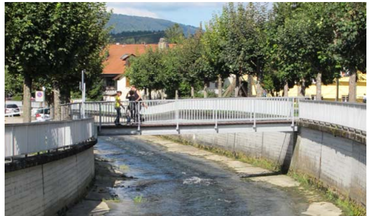
La Sorne à Bassecourt

Les mesures de protection des cours d'eau ne peuvent être envisagées qu'au travers d'une approche intercommunale. La prévention des dangers naturels peut ainsi s'accompagner d'aménagements visant la revalorisation de la nature et du paysage ainsi que l'amélioration des espaces publics et de la mobilité douce.