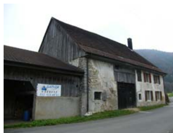
Bâtiment en vente

2. Planifier l'extension de la ZAM avec la création d'une desserte pour la mobilité douce en lien avec la gare de Glovelier ;