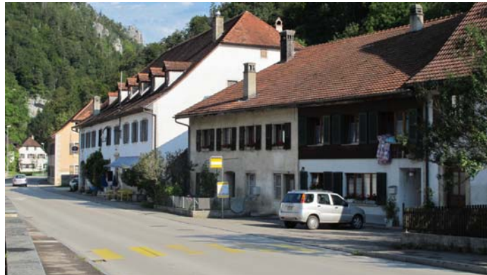
Centre ancien d'Undervelier

La vision régionale permet de réunir nos forces pour développer des projets ambitieux tels que la rénovation et la réhabilitation du bâti ancien. Elle permet également une meilleure gestion des équipements techniques et collectifs.