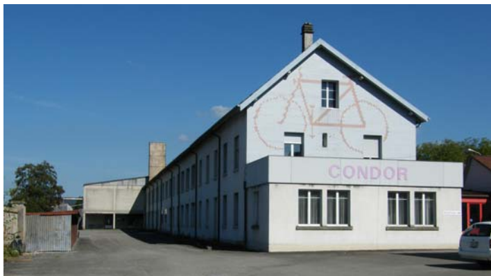
Site industriel « Condor » à Courfaivre