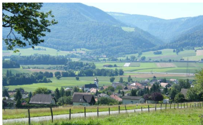
Vue sur la Haute-Sorne depuis Boécourt

Les structures environnementales existantes et la stratégie de développement conduisent néanmoins à distinguer deux types de territoire entre l'espace central et l'espace rural, correspondant à des objectifs et des traitements différenciés de la nature et du paysage.