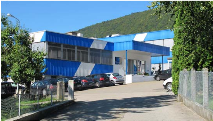
Activités économiques à Boécourt