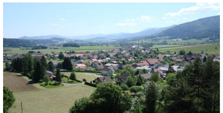
Vue sur la Haute-Sorne depuis Glovelier

Les propriétaires privés ne sont pas liés par le contenu du PDR.