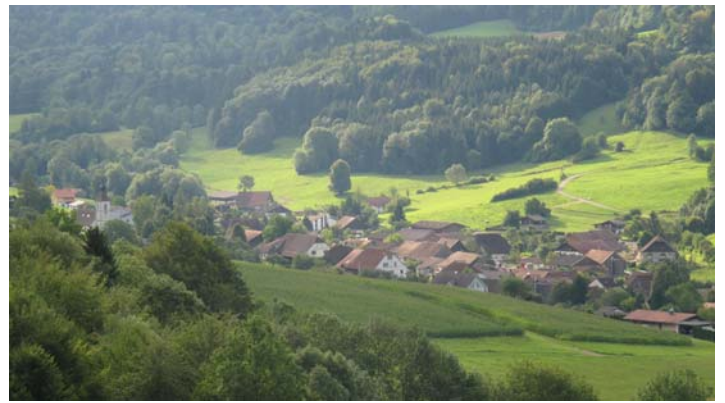
Soulce et ses qualités naturelles et paysagères